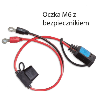
Oczka M6 z bezpiecznikiem