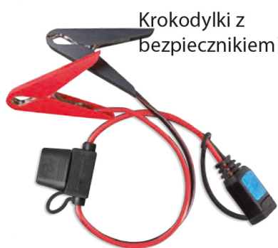
Krokodylki z bezpiecznikiem